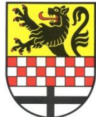
Märkischer Kreis Der Landrat