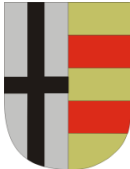
Kreis Olpe Der Landrat